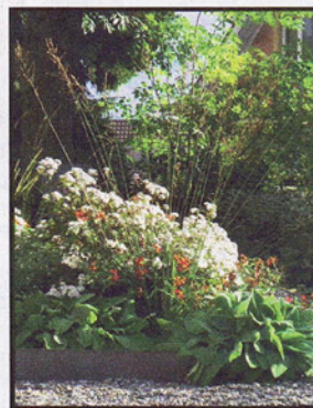
Über Stock und Stein: der Garten «Blumenräume».