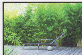
Die Ruhe selbst: Erholung im «Steinackerweg».

Bruhin auf und übernimmt die Bauleitung vor Ort.